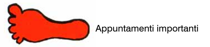
Tabella della 7° classe: I tuoi primi passi